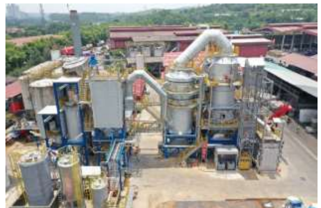
設備外観（2021年10月撮影）