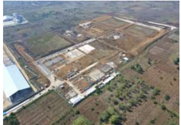
建設状況 (2021年10月撮影)

DOWAエコシステム(株)は2008年度に東南アジアへ進出し、現在インドネシア、タイ、シンガポールおよびミャンマーの4か国で、廃棄物の適正処理や再資源化などの環境・リサイクルサービスを提供しています。